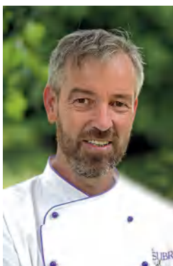
Romantik Hotel Landschloss Fasanerie Restaurants Esslibris und Landhaus Jürgen Süss Fasanerie 1 D-66482 Zweibrücken Telefon 0049 (0) 6332 9730 www.landschloss-fasanerie.com